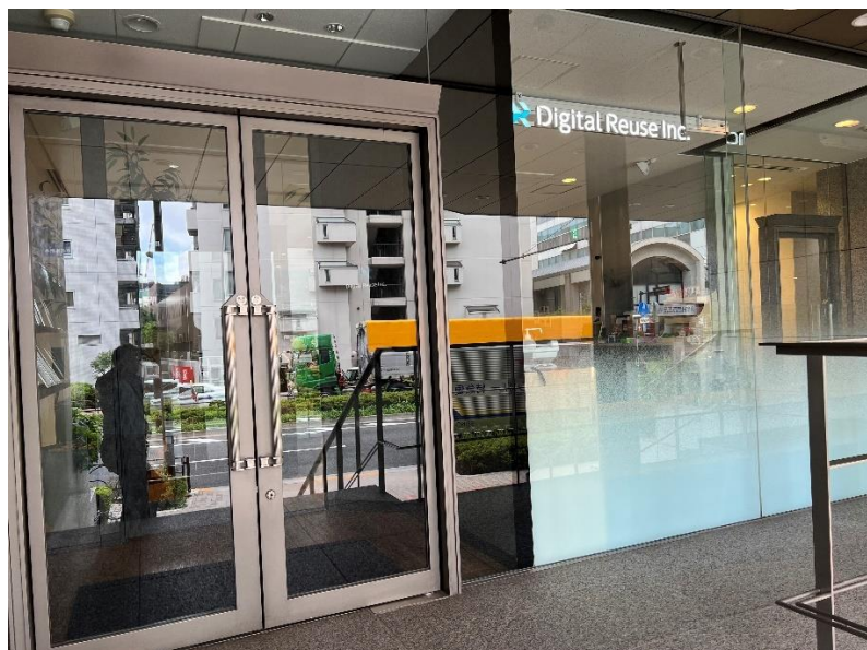
ビル向かって左側のドア