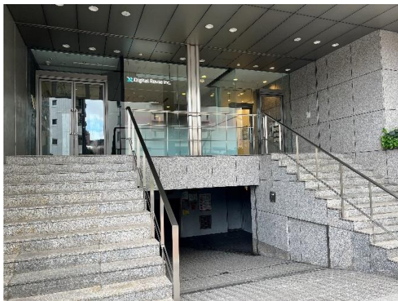
ビル1階向かって左ドアが弊社専用エントランス